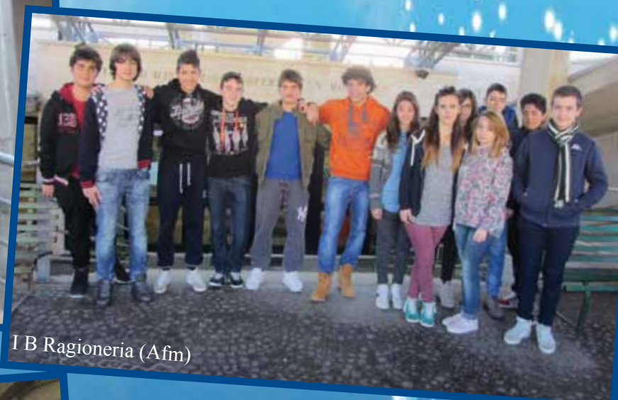
I B Ragioneria (Afm)