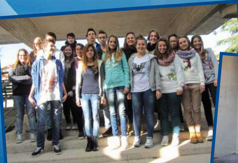
I A Turismo