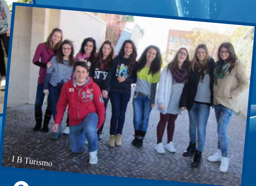
I B Turismo