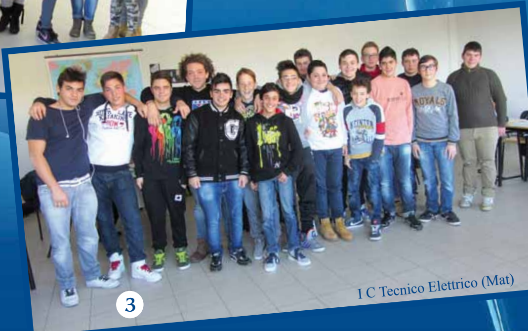
I C Tecnico Elettrico (Mat)