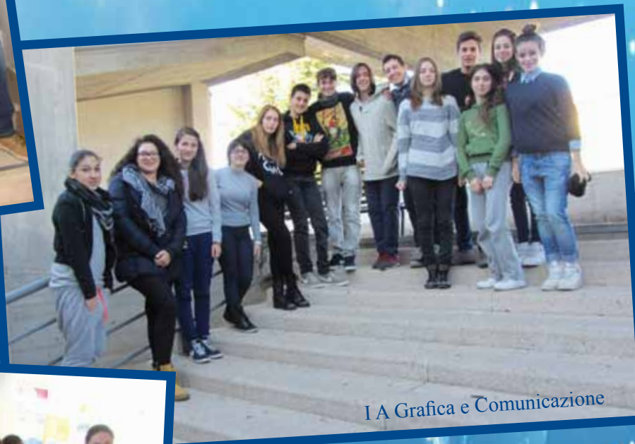
I A Grafica e Comunicazione