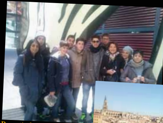
Davanti al Reina Sofia