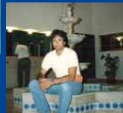
Era l'epoca dei... capelli lunghi