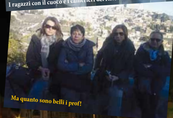
Ma quanto sono belli i prof!