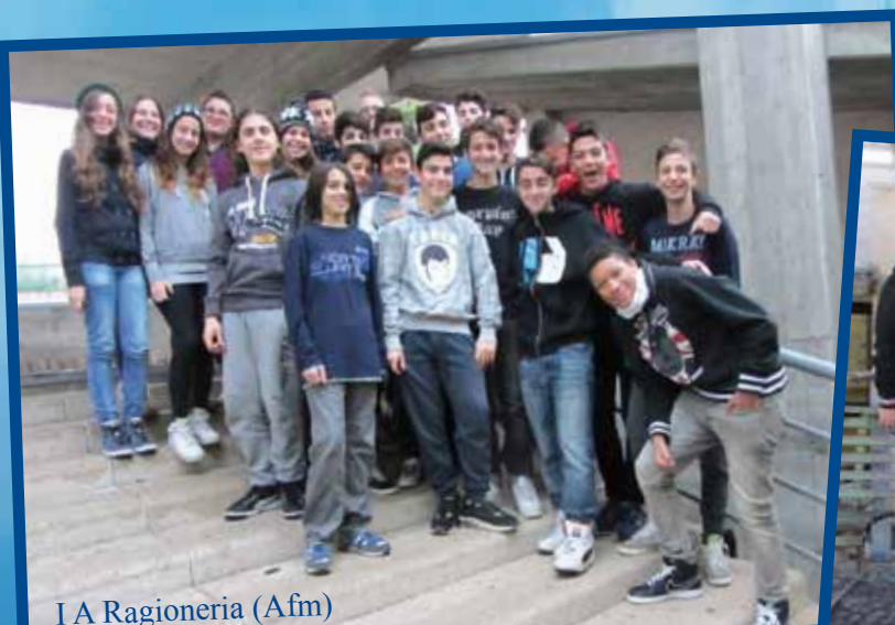
I A Ragioneria (Afm)