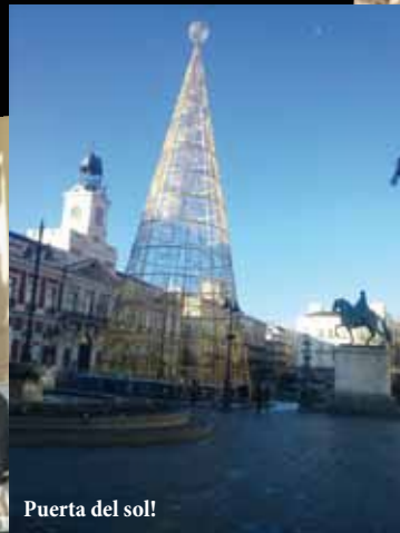
Puerta del sol!