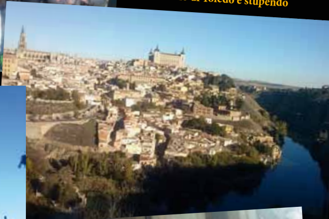
Lo scenario di Toledo è stupendo