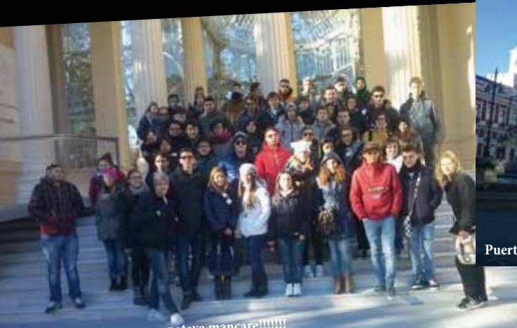
La foto di gruppo non poteva mancare!!!!!!