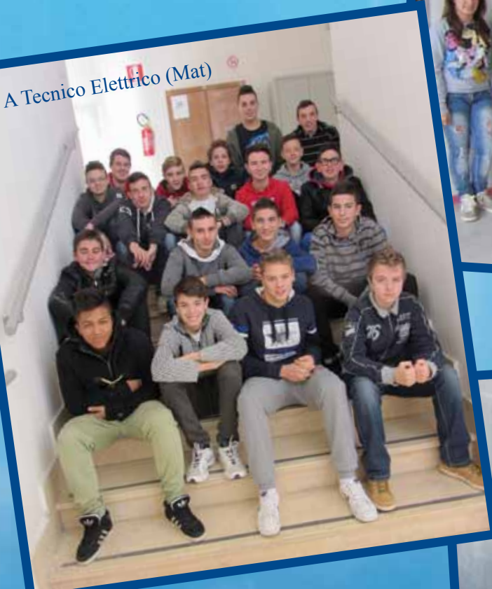
I A Tecnico Elettrico (Mat)