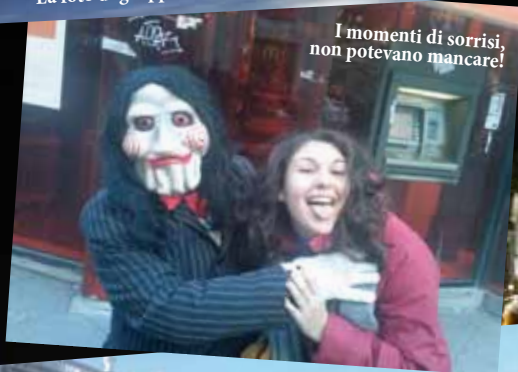
I momenti di sorrisi, non potevano mancare!