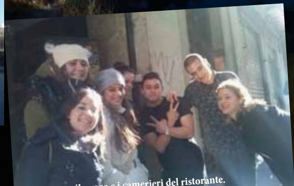
I ragazzi con il cuoco e i camerieri del ristorante.